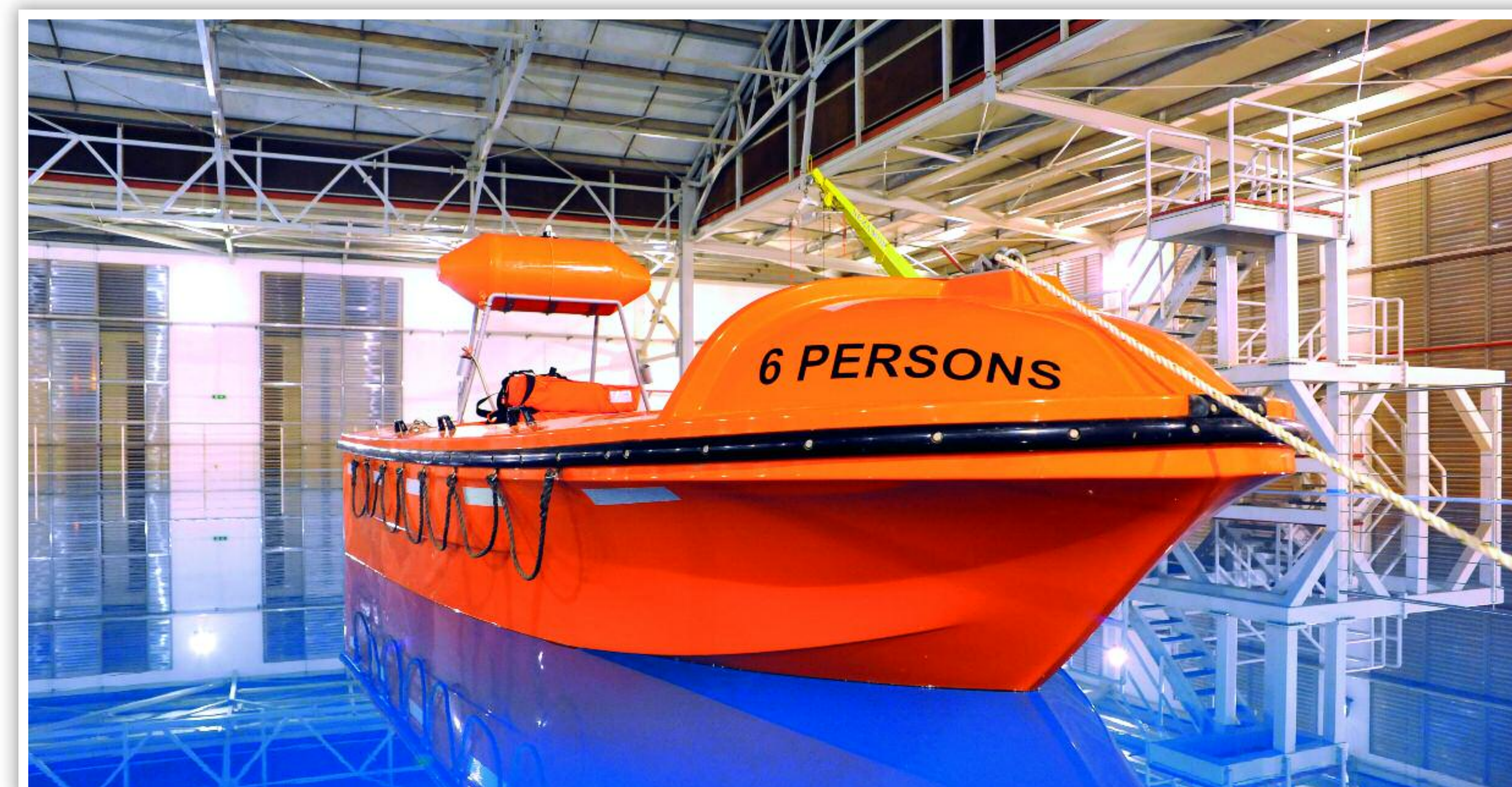
CENTRO DE SALVAMENTO MARÍTIMO – PISCINA E EQUIPAMENTO DE TREINO