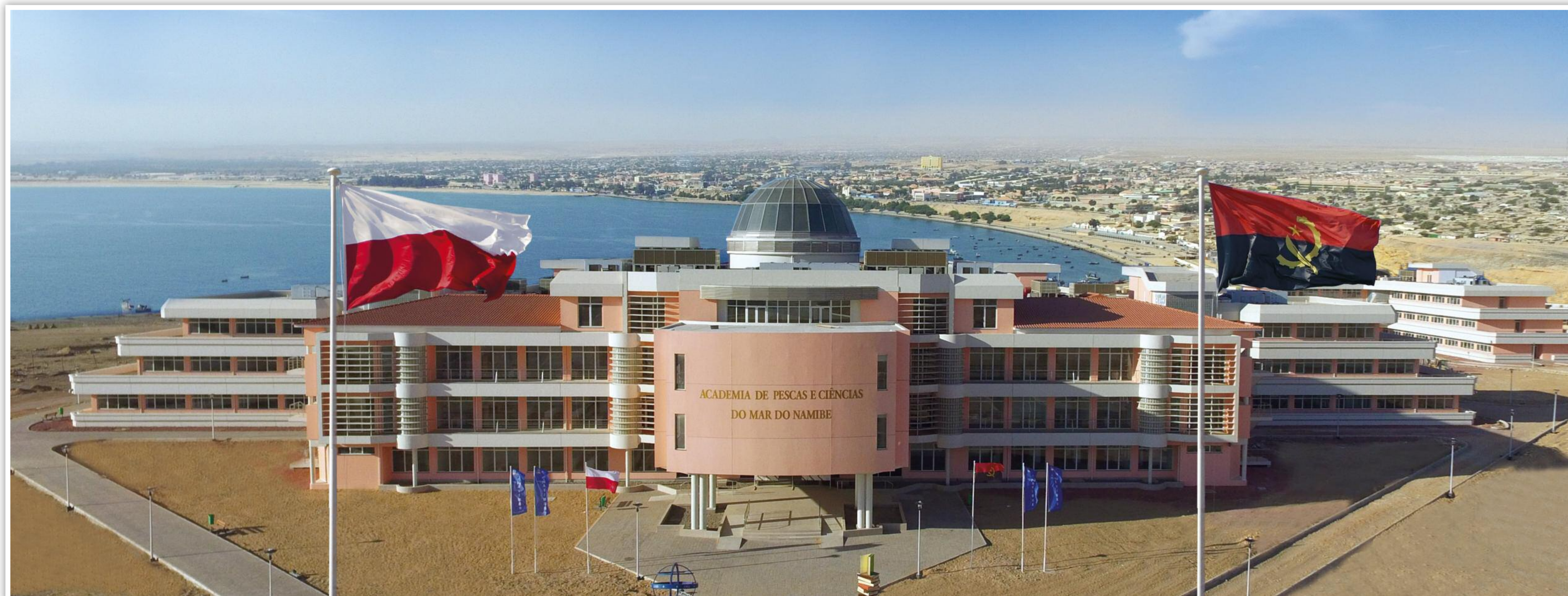
EDIFÍCIOS PRINCIPAIS DA ACADEMIA NO FUNDO DA CIDADE DE NAMIBE

O PARCEIRO EDUCACIONAL DO PROJECTO É A ACADEMIA MARÍTIMA DE GDYNIA DA POLÓNIA.