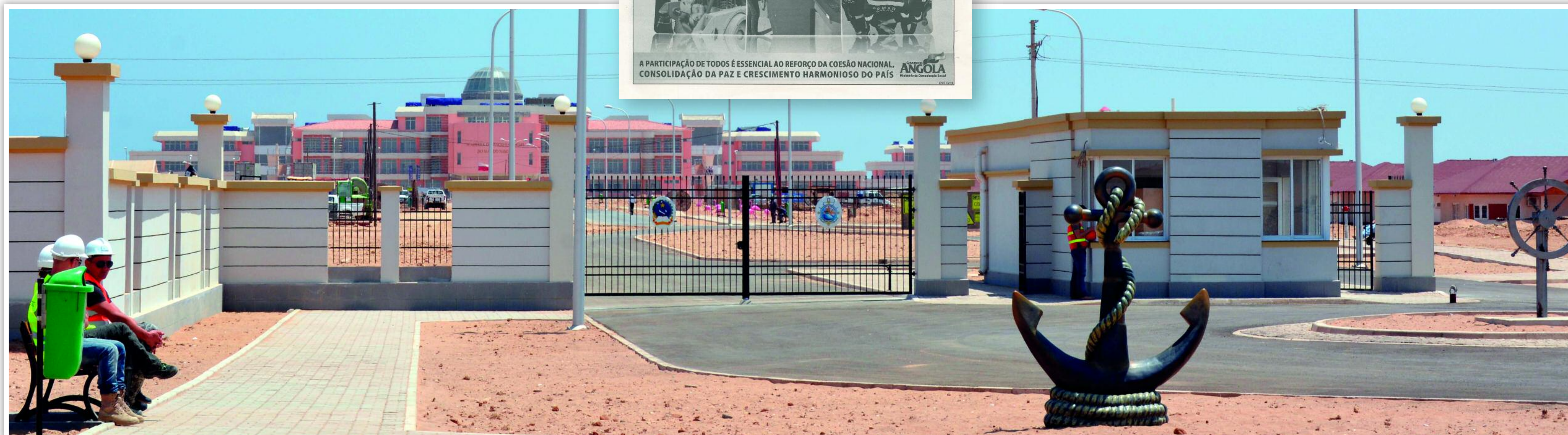
VISTA GERAL DA ACADEMIA DO LADO DO PORTÃO PRINCIPAL