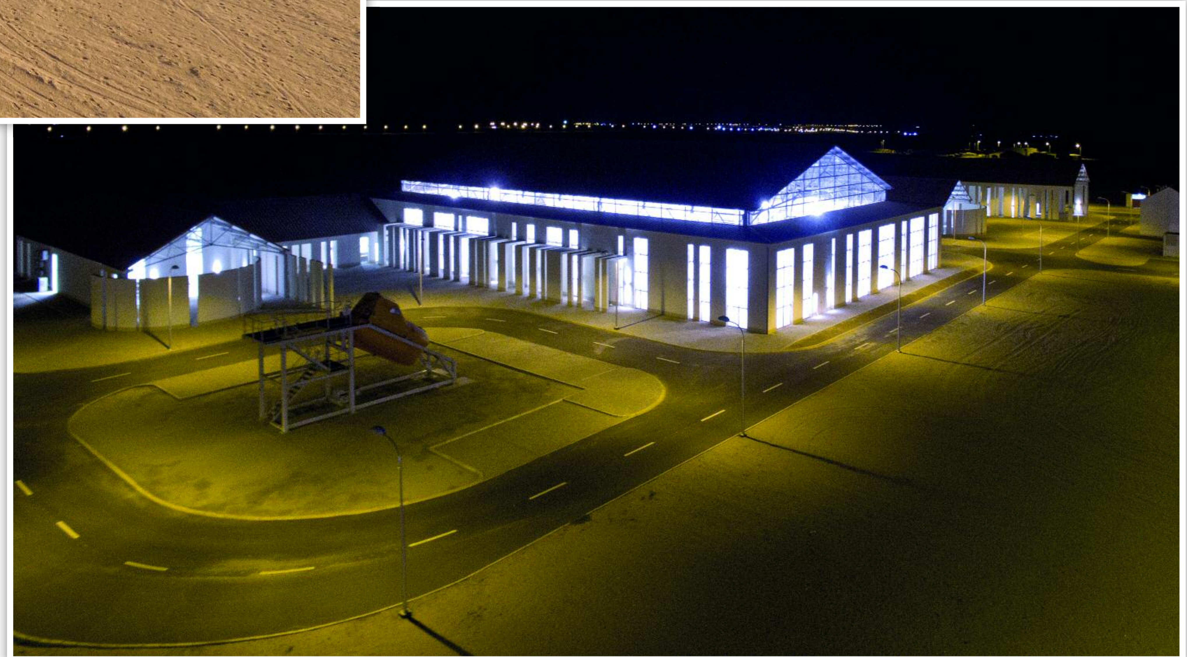
CENTRO DE SALVAMENTO MARÍTIMO E LABORATÓRIO DA CASA DAS MÁQUINAS