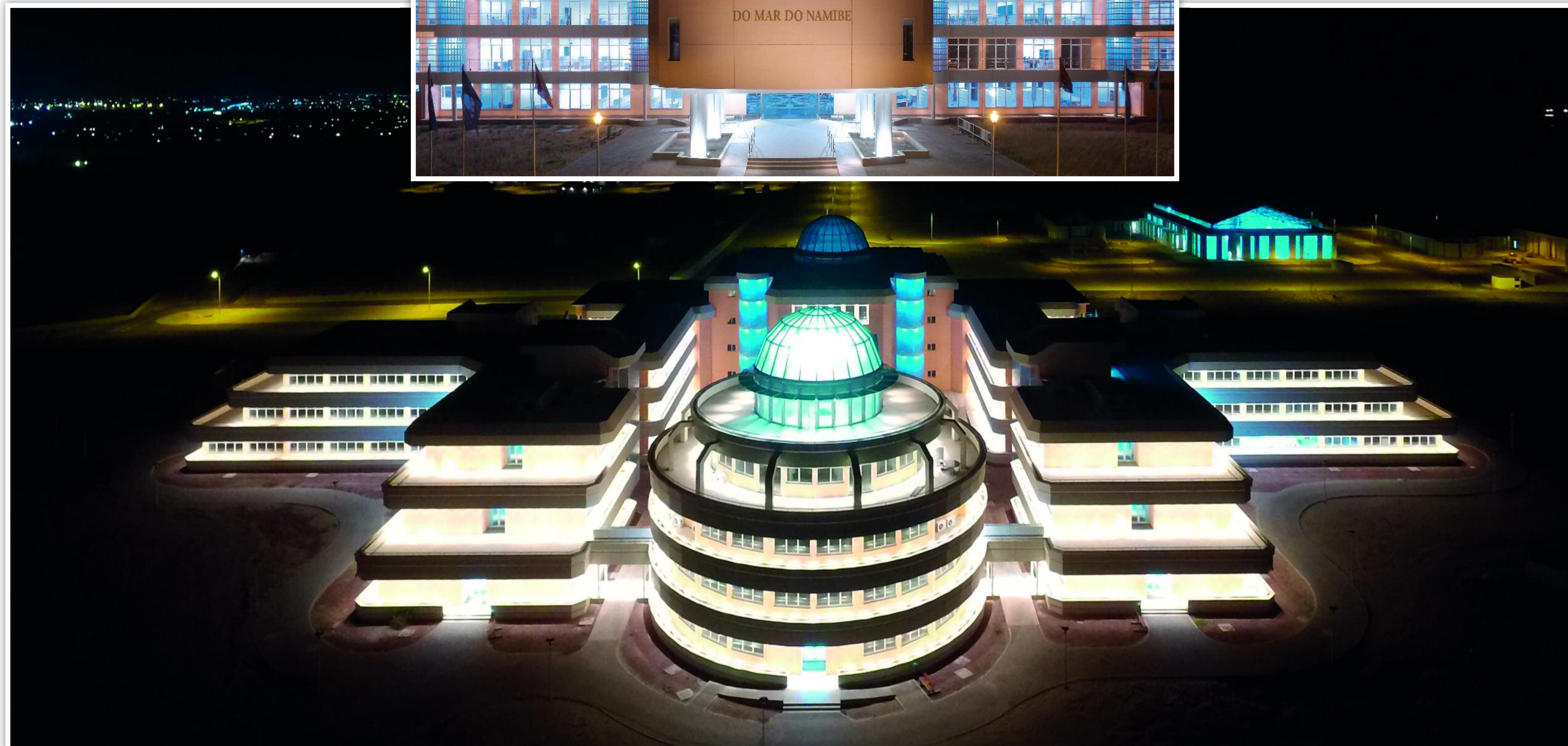
EDIFÍCIOS PRINCIPAIS DA ACADEMIA DURANTE A NOITE