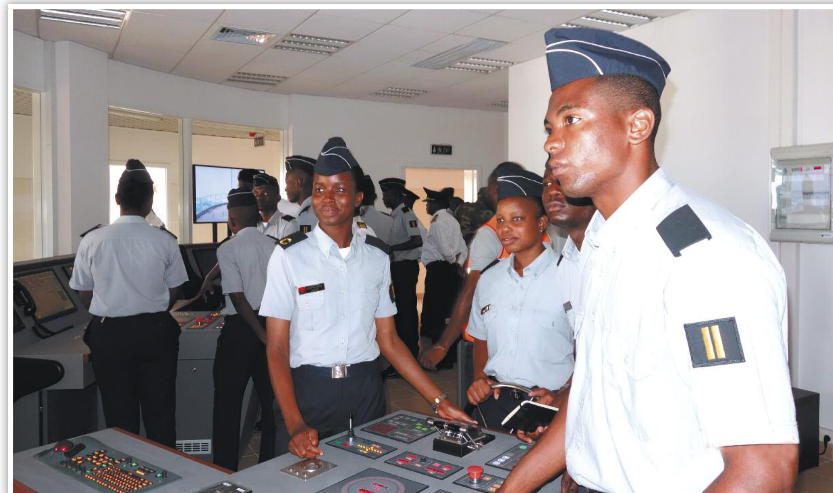
LABORATÓRIOS ULTRAMODERNOS E SIMULADORES DE NAVEGAÇÃO