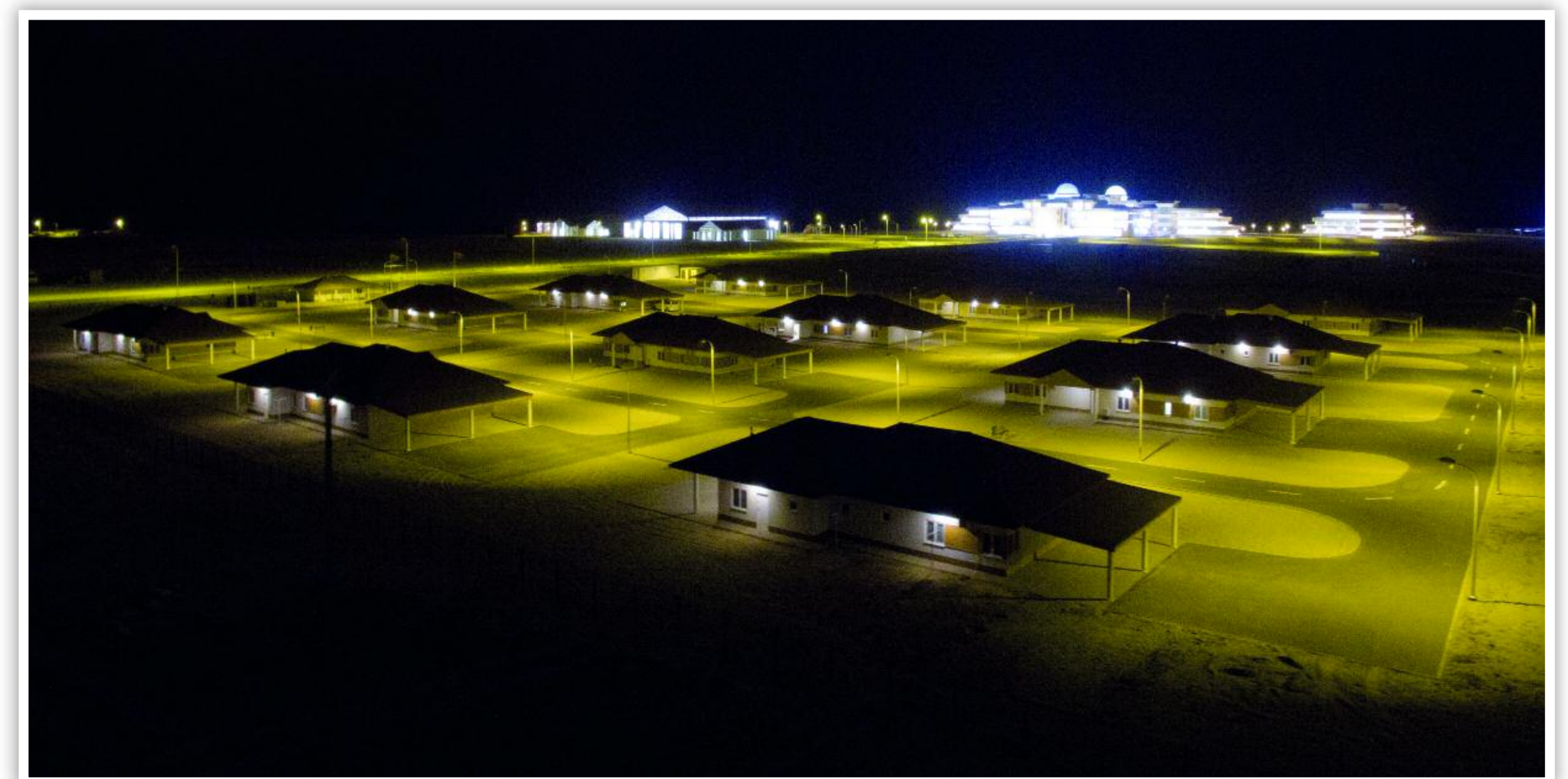
BAIRO RESIDENCIAL PARA PESSOAL ACADÉMICO